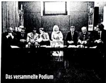
Das versammelte Podium