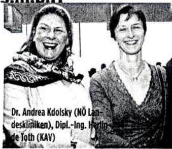
Dr. Andrea Kdolsky (NÖ Landeskliniken), Dipl.-Ing. Herlinde Toth (KAV)